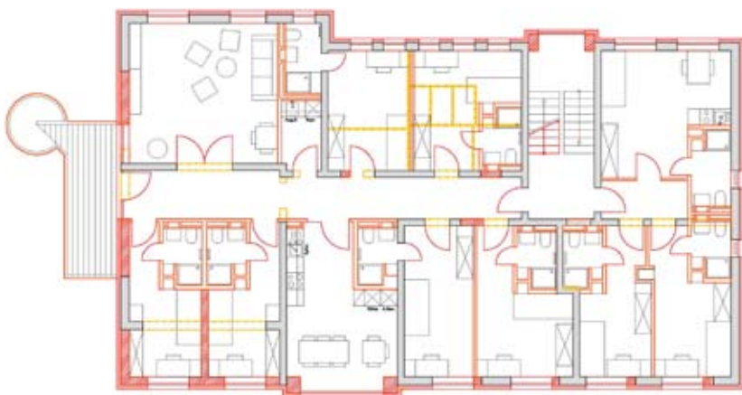
Grundriss 1. Obergeschoss